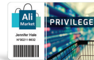
Tarjetas de fidelidad