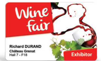
Invitaciones a eventos