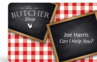
Tarjetas identificativas para empleados

Rentabilice su inversión imprimiendo todas las credenciales y tarjetas relacionadas con su actividad. Sustituya únicamente los consumibles en las soluciones Flex y Duplex para imprimir en color sobre tarjetas blancas: